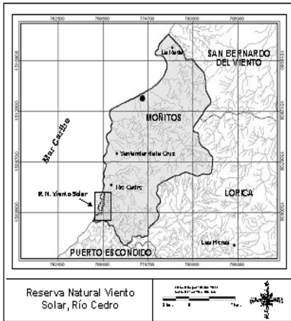
Figura 1. Localización geográfica Reserva Natural Viento Solar, Río Cedro, Moritos, Departamento de Córdoba-Colombia.

cálido húmedo, con temperatura promedio anual de 27.5°C, precipitación de 1456 mm/año y humedad relativa de 88%. El área cuenta con un sendero principal de 3 km con cobertura boscosa lineal, y una red de senderos peatonales al interior del bosque. Varias fuentes de agua circulan por el bosque: quebrada la Vega, río Cedro, río Mangle, caño del Tigre, cañito del Gobierno, caño Candé, La Isidra, que terminan en un bosque de manglar compuesto por Conocarpus erectus y Rhizophora mangle .