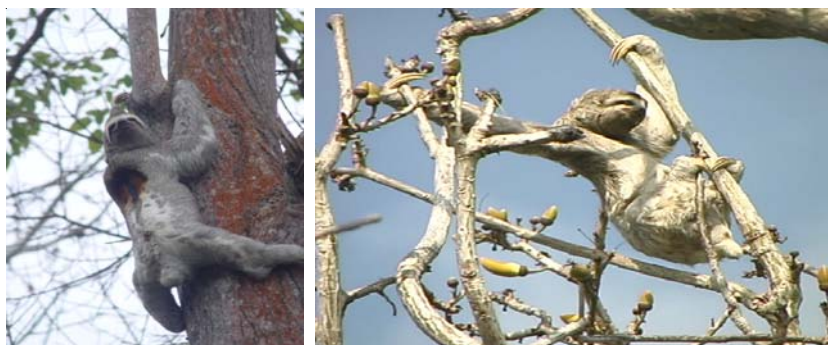
Figura 4. Aspecto general del oso perezoso ( Bradypus variegatus ) trepando un árbol de bonga, y ubicándose en las ramas más altas. Obsérvese la franja de color naranja sobre el lomo, característica de los machos adultos.

Observaciones de campo confirman que los osos perezosos tres dedos, en la RNVS presentan hábitos diurnos y nocturnos. Al iniciar el día se observó que la especie acostumbra a posicionarse en lo más alto de las ramas de árboles de Pseudobombax septenatum (bonga). Estos animales son de hábitos solitarios (Figura 4); sin embargo, en algunas ocasiones durante los censos realizados, se registraron 14 grupos integrados por tres a cuatro individuos,