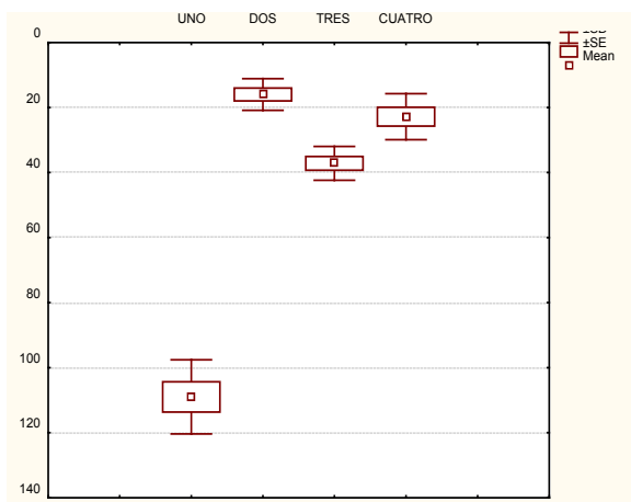
Figure 2. Statistical difference of the population determined between the sampling sites.

Significant differences were determined when Friedman's Anova was used to compare populations between sampling sites ( N=6 , df=3 ) = 17.00000; p<0.00071 , site 1 differing significantly (Figure 2).